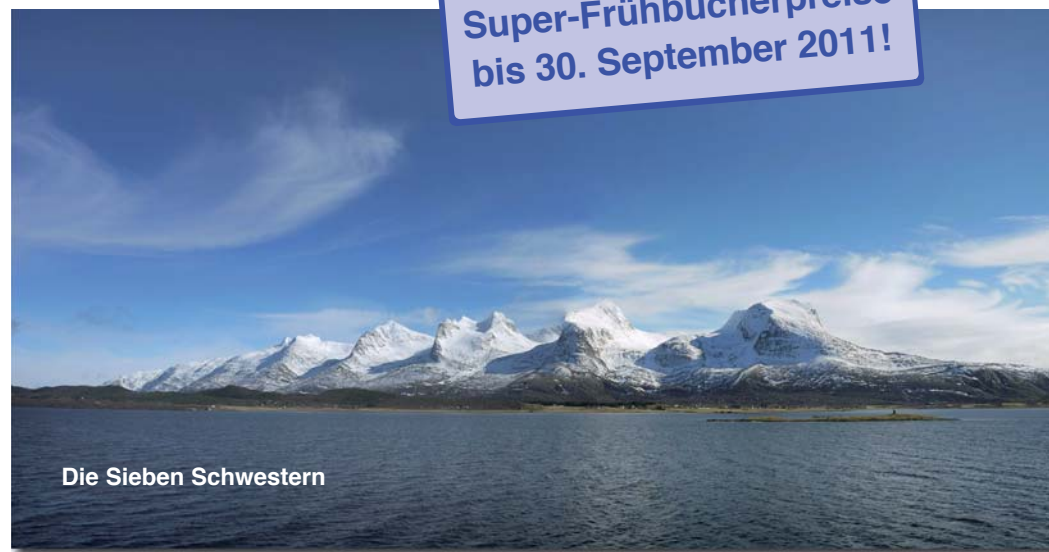
Die Sieben Schwestern

Super-Frühbucherpreise bis 30. September 2011!