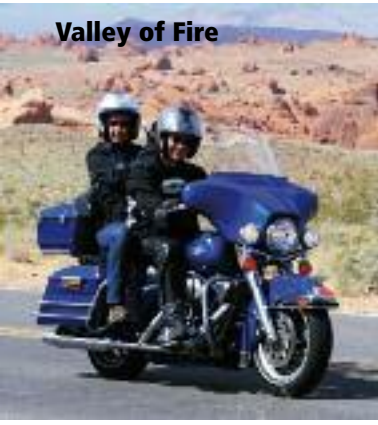
Valley of Fire