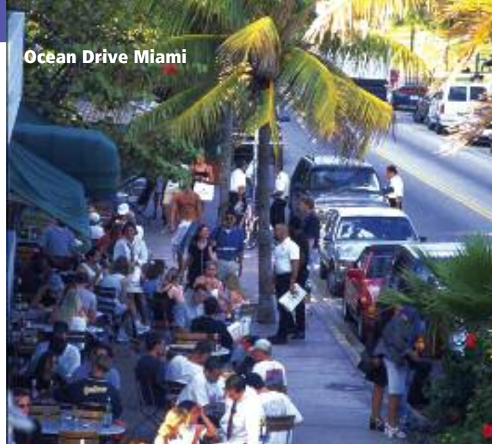
Ocean Drive Miami

Wer hat nicht schon einmal davon geträumt, mit der Harley der untergehenden Sonne entgegenzurollen, auf einem Highway, den irgendwo in der Ferne das Meer verschluckt, warmen Wind auf der Haut zu spüren mit dem Gefühl im Bauch, alles Glück dieser Welt zu besitzen.