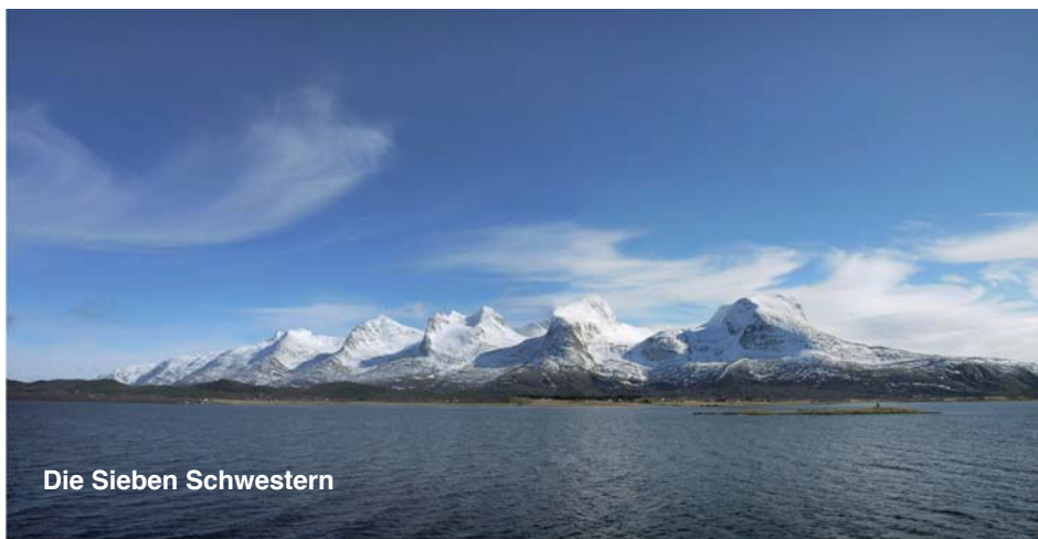
Die Sieben Schwestern