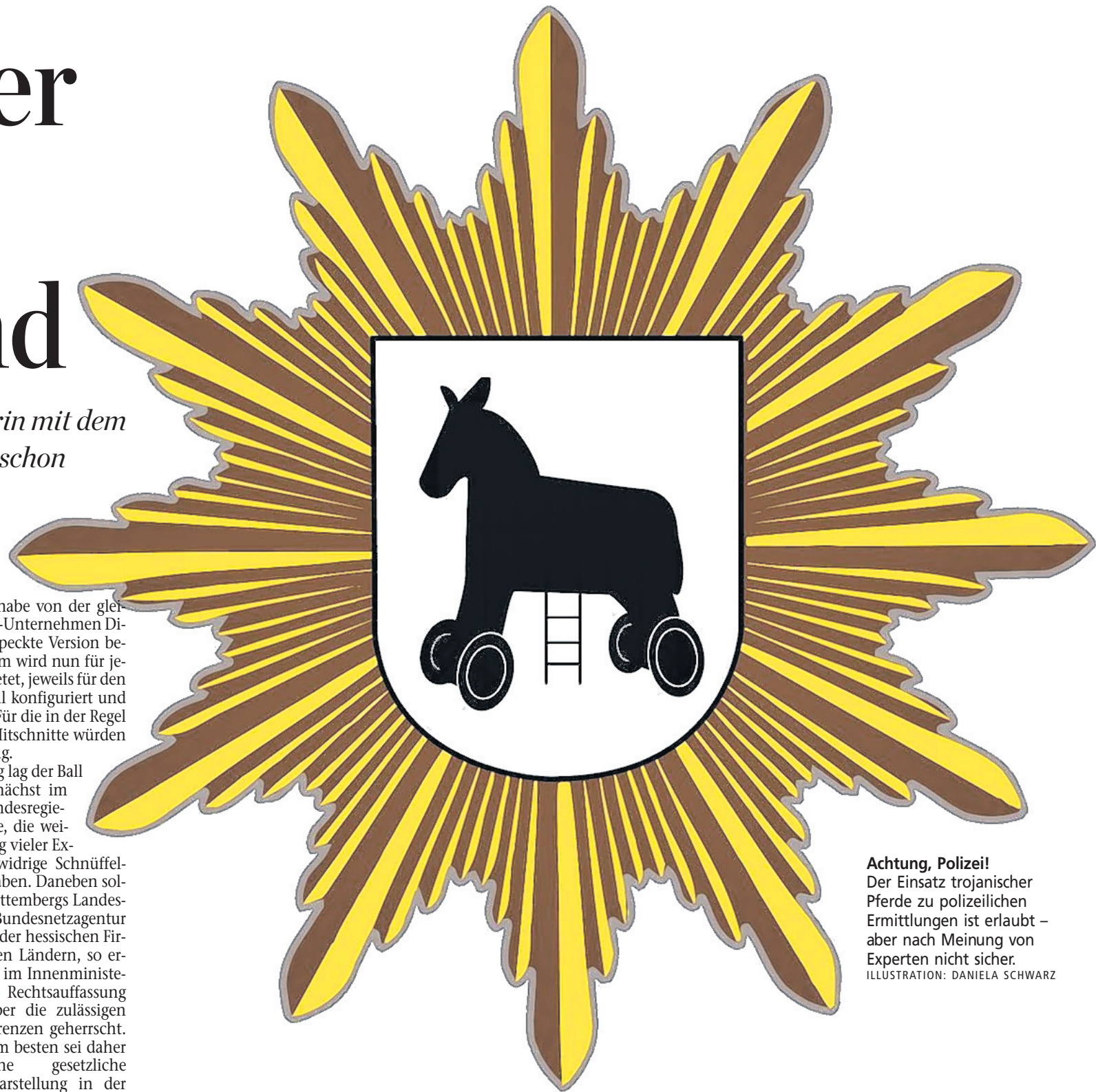
Achtung, Polizei! Der Einsatz trojanischer Pferde zu polizeilichen Ermittlungen ist erlaubt – aber nach Meinung von Experten nicht sicher. ILLUSTRATION: DANIELA SCHWARZ

Auch Constanze Kurz, Sprecherin des CCC, hält das Verfahren prinzipiell für fragwürdig. „Es ist immer ein Infiltrieren des privaten PC, und damit sind die Türen offen“, sagte sie dieser Zeitung. Laut Kurz gibt es für die Ermittler auch andere Möglichkeiten, um an Skype-Telefonate heranzukommen. Welche? Ganz einfach: „Bei Skype direkt“.