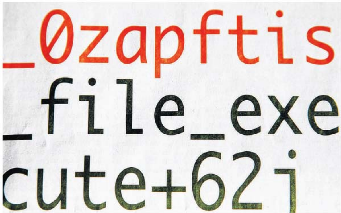
„Bundestrojaner“: Dem Chaos Computer Club ist „staatliche Spionage-Software“ zugespielt worden, die als rechtlich bedenklich gilt.